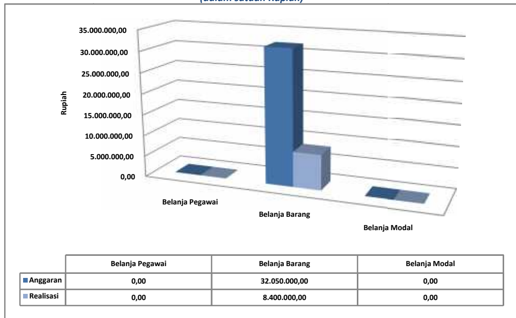
Tabel 4 Komposisi Anggaran dan Realisasi Belanja per 30 Juni TA 2019 (dalam satuan Rupiah)